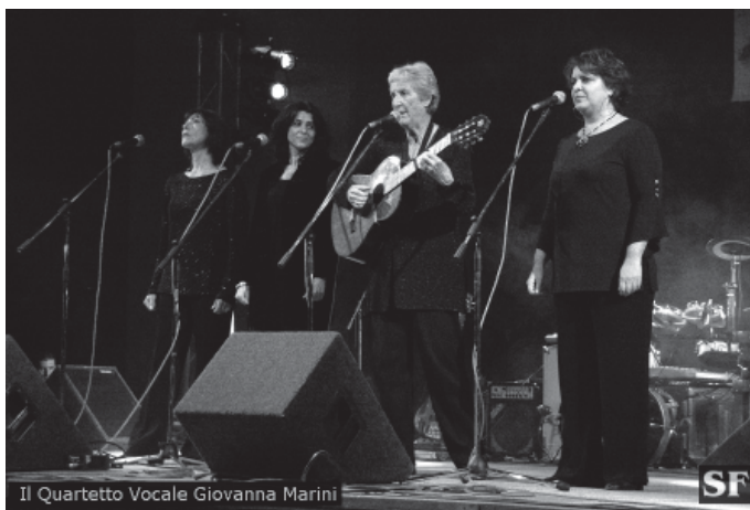
Il Quartetto Vocale Giovanna Marini